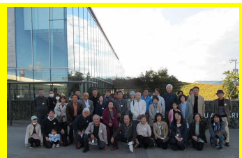
見学旅行（家族も参加）